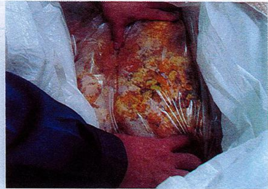
写真2 エコマネジメントにおいて取り扱う梅の種とみかんのしぼりかす

量はお茶類、おから、梅類が多く、供給元は梅類とみかんが多くなっている。後者については、和歌山県は近年、梅とみかんの収穫量が全国1位であり、これらを原料とした食品製造業者も多く立地していることが影響しているであろう。写真2は食品製造業者から供給される梅の種とみかんのしぼりかすである。