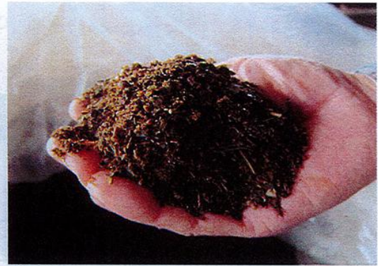
写真3 自社牧場で給与されるエコフィード

ための手間がかかること、現状の配合飼料より低価格でなければ売れないことが挙げられている。繁殖和牛向けの飼料だけでは利益が確保できないため、肥育牛向け飼料・TMRの開発にも取り組んでいる。