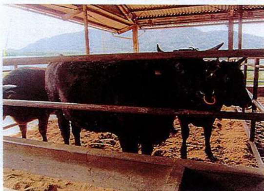
写真1 エコマネジメントの自社牧場

平成29年度の実績として、エコマネジメントが取り扱った食品残さ3700トン为原料